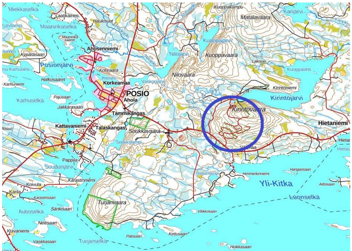
ALUEEN YLEISSIJAINTI. MUUTOSALUE SINISEN YMPYRÄN SISÄLLÄ

Kaavoitustyön tarkoituksena on muuttaa asemakaavaa siten, että myös pysyvä asuminen on mahdollista. Samalla on kaavamääräykset tarkoitus laittaa ajan tasalle, tarkistaa kortteleiden ja rakennuspaikkojen rajat sekä kiinteistörajat toisiaan vastaavaksi ja tehdä muut tarpeelliset muutokset. Tällä hetkellä alueen korttelit ovat loma- ja matkailurakentamiseen tarkoitettuja (RA, RA-1, RM). Kaava-alue on n. 5 km Posion keskustaajamasta itään. Muutosalueen pohjoispuolella on vireillä Ala-Kirin ranta-asemakaavan muutos mahdollisesti asemakaavaksi. Alueen yleissijainti on oheisella kartalla.