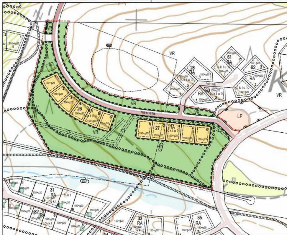
KORTTELEITA 26 JA 27 YM KOSKENUT 2020 HYVÄKSYTTY MUUTOS